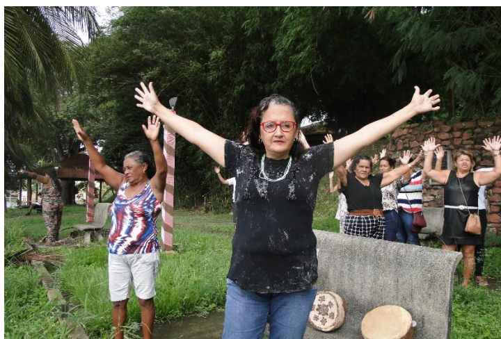
Lideranças de Mulheres Ribeirinhas e Quilombolas durante o Módulo II do Curso – Local UFPA Campus Altamira