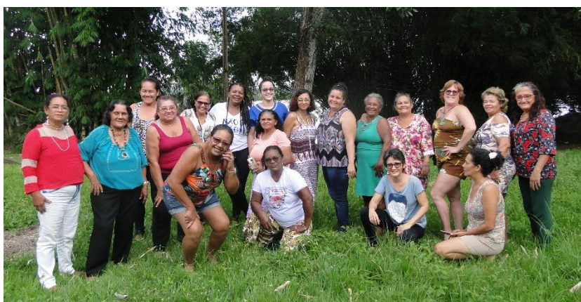
Mulheres do Coletivo de Mulheres do Xingu e grupos e coletivos convidados representantes de Altamira, Vitória do Xingu, Souzel, Porto de Moz, Anapu e Medicilândia – Curso sobre Saúde Integral – Módulo II – Local: UFPA Campus de Altamira Foto: Eneida de Melo, 2019

O terceiro módulo aconteceu numa ação compartilhada entre projeto e o coletivo em formação. As 19 mulheres e 1 homem participantes do curso deram como contrapartida ao projeto a tomada de responsabilidade com as suas despesas de transporte e alimentação. A hospedagem foi solidária (Maravaia - Espaço de (Con)Vivência em Educação, Cultura e Ambiente). O projeto somou com a complementação alimentar, energia, água, gás, diárias de cozinheira. O coletivo experimentou na prática uma iniciação ao método bioenergético, como fazer a