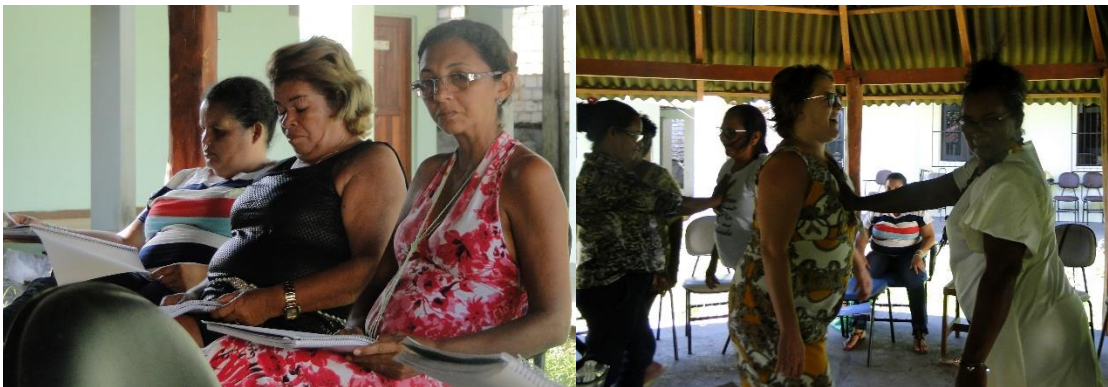
Lideranças de Mulheres de Medicilândia, Souzel e Anapu (esq. para a dir. foto 1) e de Altamira (foto 2) durante o Módulo II do Curso – Local UFPA Campus Altamira Foto: Socorro Damaseno, 2019