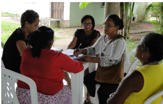
Trabalhos em Grupo