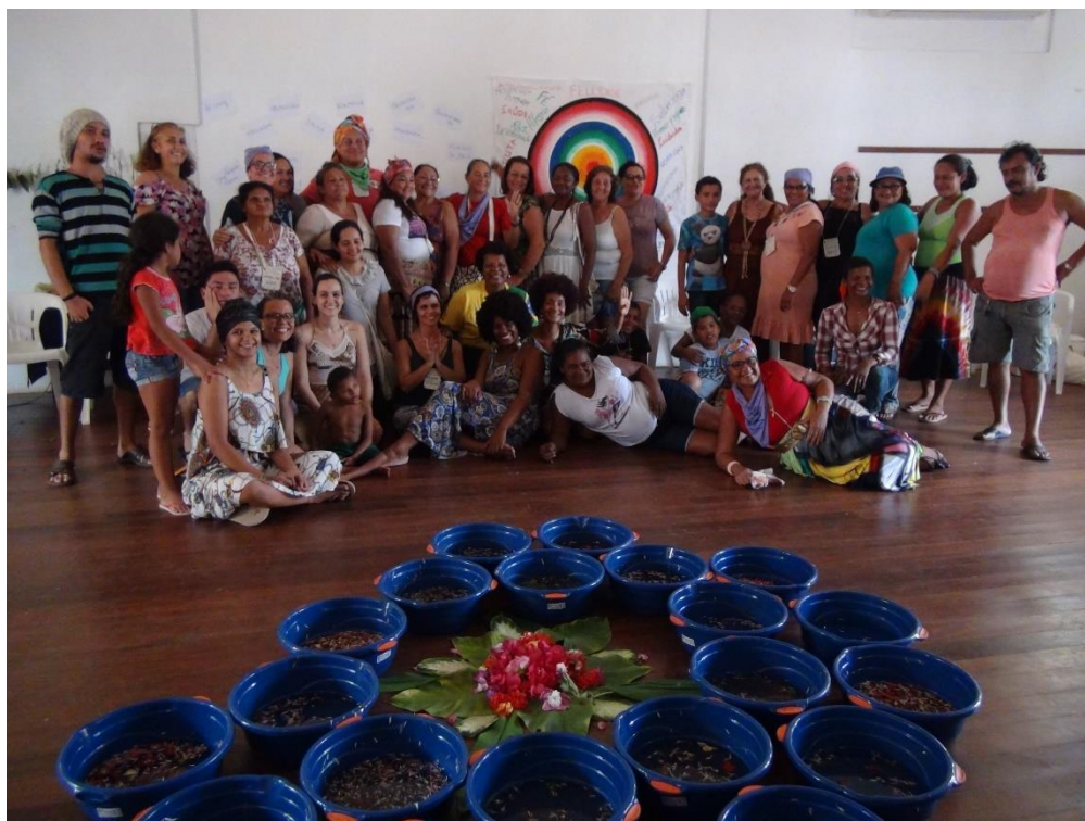
Jovens e Mulheres do Coletivo de Mulheres do Xingu e grupos e coletivos convidados representantes de Altamira, Vitória do Xingu, Souzel, Porto de Moz, Anapu e Brasil Novo Terapeutas de Altamira, Vitória do Xingu e Brasil Novo, Pará e Salvador, Bahia

milenaes utilizadas pela medicina integrativa, e incorporar estas no cotidiano da medicina convencional, esta última ofertada pelo poder público, o Encontro sobre Saúde Integral pretendeu incentivar o compartilhamento de experiências na área da saúde junto as mulheres desse recorte do território Xingu para que esses conhecimentos e práticas possam fluir em rede entre essas comunidades.