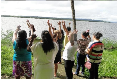
Jogos Teatrais e Exercícios Terapêuticos (fotos acima) 2019