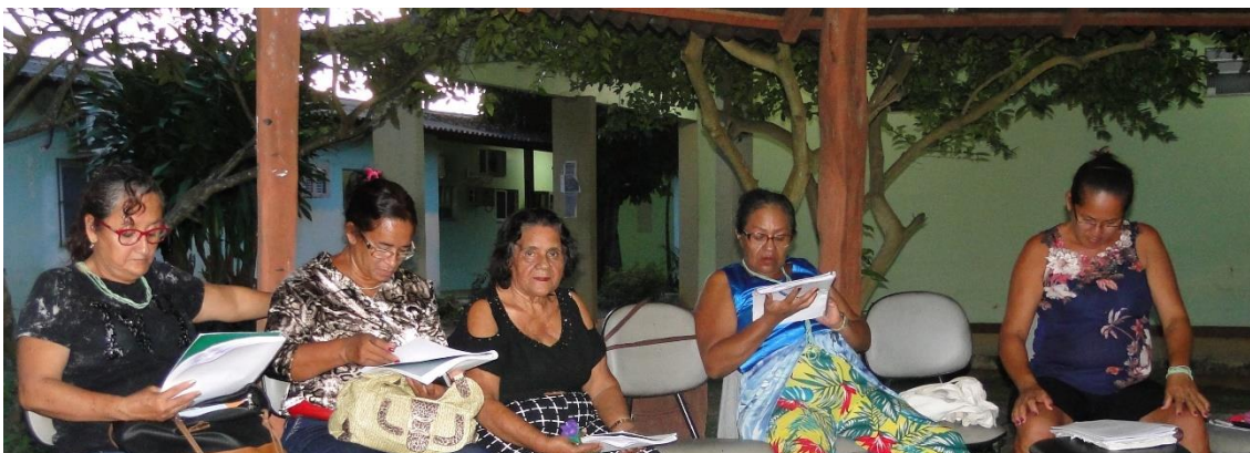
Lideranças de Mulheres de Vitória do Xingu e Porto de Moz durante o Módulo I do Curso – Local UFPA Campus Altamira Foto: Socorro Damaseno, 2019

meta, espera-se que essas lideranças incentivem através de seus trabalhos a ampliação da consciência de novas mulheres em suas comunidades na divulgação e disseminação das informações sobre Cuidado e Auto-cuidado para a saúde integral e sustentabilidade.